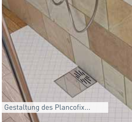
Gestaltung des Plancofix...