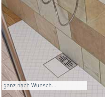
ganz nach Wunsch...