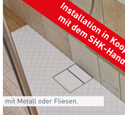
mit Metall oder Fliesen.

Installation in Kooperation mit dem SHK-Handwerk